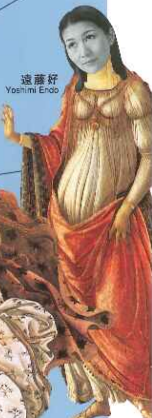
遠藤好 Yoshimi Endo