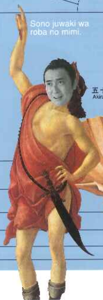
五十嵐明 Akira Igarashi